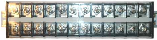
Рисунок 2. Фотографии клеммных блоков серии ТВ, ТВС, и TD.